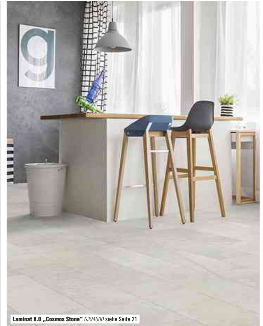
Laminat 8.0 „Cosmos Stone“ 6394000 siehe Seite 21